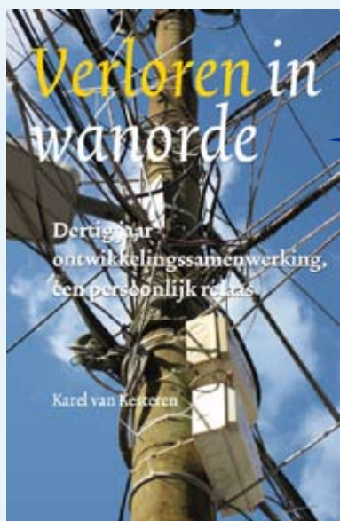
Verloren in wanorde

Memoires van diplomaat en ontwikkelingsdeskundige Karel van Kesteren/ KIT/ 216 pagina's / € 19,50